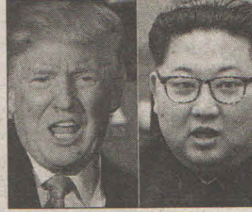
অভিযোগ, পরমাণু পরীক্ষাকেন্দ্র ধ্বংস প্রক্রিয়া দেখতে ডাকা হয়নি ফরেনসিক বিশেষজ্ঞদের

হোয়াইট হাউসের মুখপাত্রটি এদিন সংবাদমাধ্যমকে বলেন, 'ঠিক ছিল ১২ জুনের আগে হোয়াইট হাউসের ডেপুটি চিফ অব স্টাফের সঙ্গে বৈঠক করবে উত্তর কোরিয়ার এক প্রতিনিধিদল। চিফ অব স্টাফ যথারীতি সিঙ্গাপুর যান। অথচ উত্তর কোরিয়া তাদের কোনও প্রতিনিধিদলকে সেখানে পাঠায়নি। সেটা হোয়াইট হাউসের ডেপুটি চিফ অব স্টাফকে জানাবার প্রয়োজনও বোধ করেনি। মুখপাত্রটি এর সঙ্গে উল্লেখ করেন আমেরিকার সঙ্গে দক্ষিণ কোরিয়ার সেনা মহড়া নিয়ে উত্তর কোরিয়ার আপত্তির বিষয়টি।