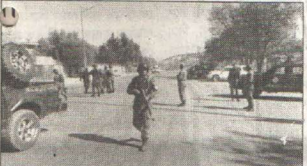
হামলার ঘটনার পরপরই বেসরকারি এই টেলিভিশন চ্যানেল এলাকায় পুলিশের সতর্ক অবস্থান।